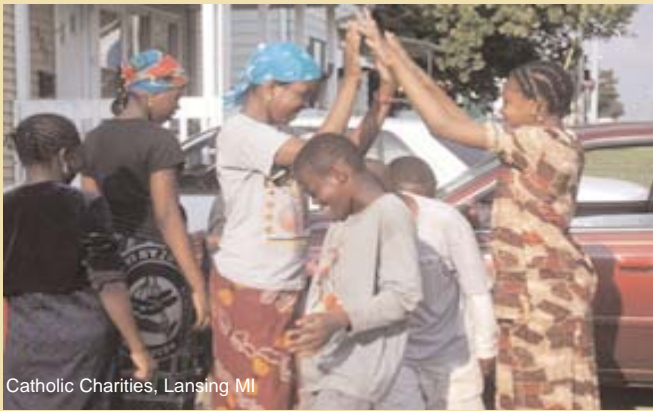
Catholic Charities, Lansing MI