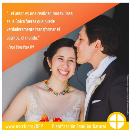
Imagen: inglés | español