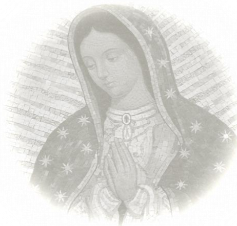
Imagen: Un mosaico de Nuestra Señora de Guadalupe decora un altar lateral de la Iglesia Santa Maria Regina della Famiglia en Ciudad del Vaticano, 15 de diciembre (foto CNS/Paul Haring).

Si una amiga te confiara que ha tenido un aborto, ¿podrías escuchar y responder de una manera que la acerque más al perdón y a la sanación? Entérate en Cómo hablarle a una amiga que ha tenido un aborto ( www.usccb.org/amiga-tuvo-aborto ).