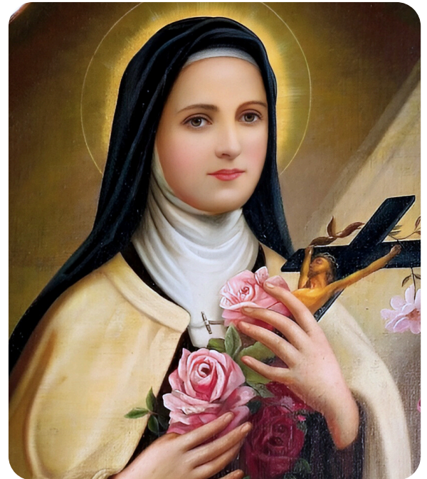
Santa Teresita de Lisieux

Santa Teresita de Lisieux, “la Pequeña Flor”, comprendió profundamente el corazón dulce y humilde de Jesús. Al contemplar cómo ser transformada por el amor de Cristo, reflexionó que “Lo que le agrada [a Jesús] es verme amar mi pequeñez y mi pobreza, es la esperanza ciega que tengo en su misericordia... cuanto más débil se es, sin deseos ni virtudes, más cerca se está de las operaciones de ese Amor consumidor y transformante” (Carta 197 a Sor María del Sagrado Corazón, 17 de septiembre de 1896). Unámonos a Santa Teresita en la oración para que nuestros corazones sean humildes como Jesús.