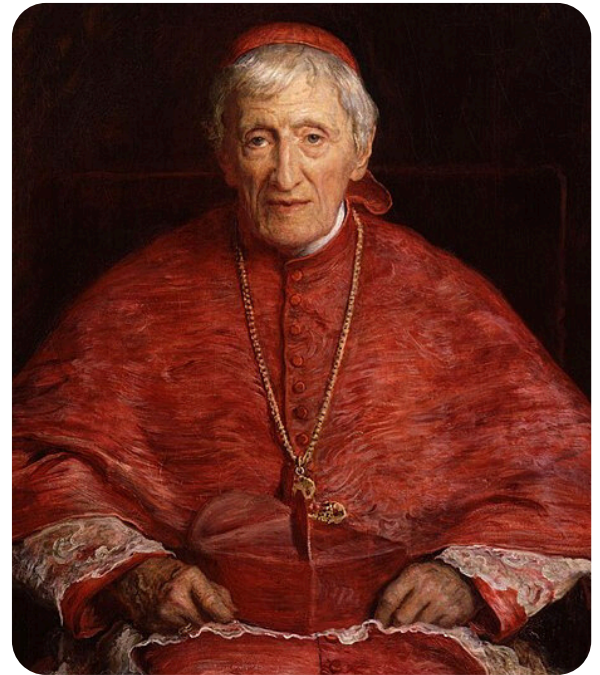
San John Henry Newman por Sir John Everett Millais

San John Henry Newman tomó el lema episcopal Cor ad cor loquitur (“El corazón habla al corazón”), entendiendo que el Señor nos salva hablando a nuestro corazón desde su Sagrado Corazón. Fue en la Sagrada Eucaristía, la mayor forma de alabanza a Dios, donde San John Henry Newman cultivó su encuentro más profundo con el corazón vivo de Jesús. Oremos con San John Henry Newman para que podamos escuchar al Sagrado Corazón que nos habla cuando alabamos y adoramos a Jesús en la Eucaristía.