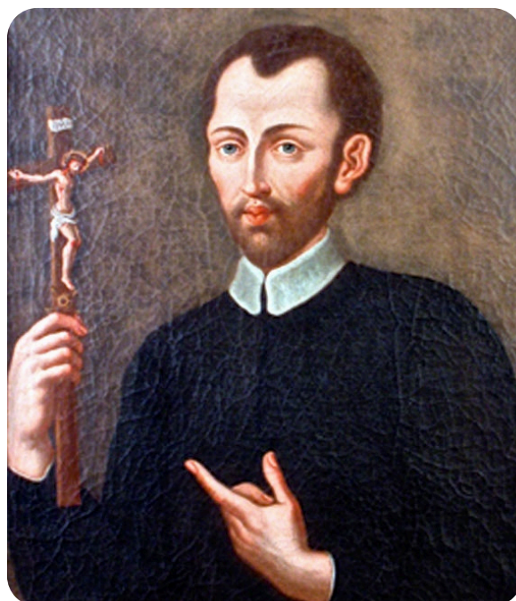
San Alfonso María de Liguorio

Al considerar el Sagrado Corazón de Jesús y el gran amor de Cristo por la humanidad, reflexionamos sobre cómo hemos fallado en alcanzar su amor y la necesidad de expiar nuestros pecados. También aprovechamos este momento para arrepentirnos como nación por los pecados del pasado de nuestro país. Oremos por el perdón y la sanación de los daños causados por los pecados originales de la esclavitud y el racismo de nuestra nación. Un elemento central de la devoción al Sagrado Corazón es la reparación – la práctica de enmendar los errores que hemos cometido, pidiendo a Cristo que perdone nuestros pecados y convierta nuestros corazones para amar como Él ama. Oremos con San Alfonso María de Liguorio, fundador de los Redentoristas, mientras expiamos nuestros pecados y nos consagramos al corazón de Jesús: